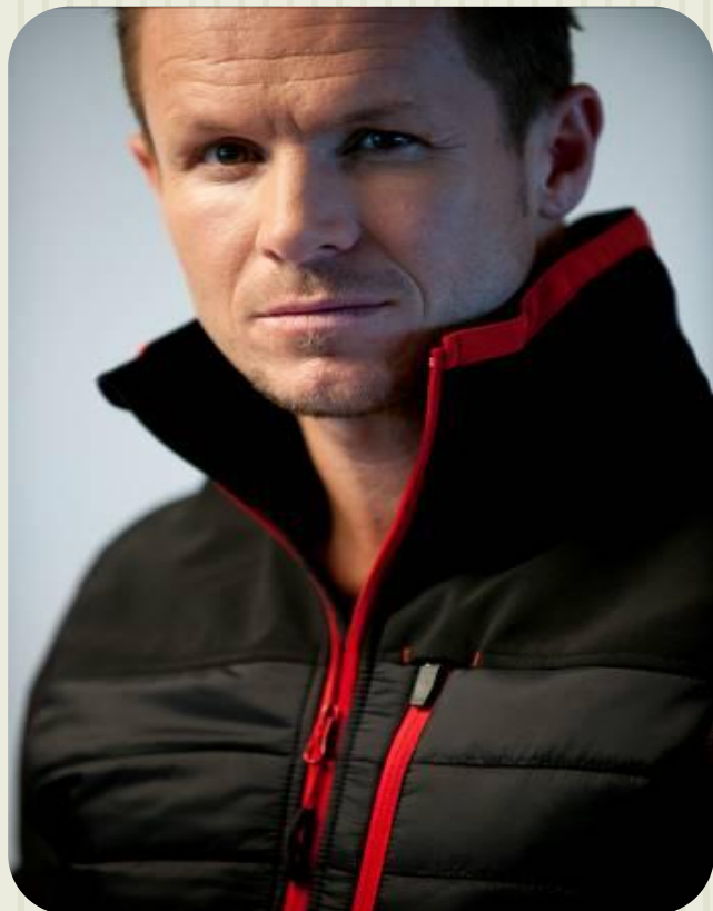
* Феликс Баумгартнер, бейсджампер, «лицо» бренда

Бренд Northland существует с 1973 года. В России представлен с 2005 г.